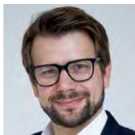
主任：Vitali Gretschko 博士、教授 市场设计