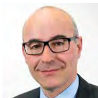
代理主任: 王亚心 (Achim Wambach) 博士、教授 环境与资源经济学环境管理