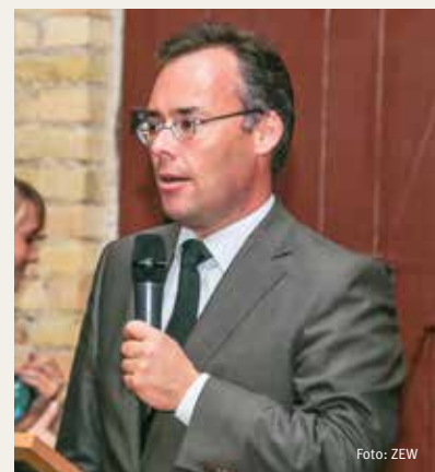
Peter Friedrich spricht beim Conference Dinner.

Europa und Internationale Angelegenheiten in Baden-Württemberg. Der Minister erläuterte, dass sich Baden-Württembergs Arbeitsmarkt derzeit sehr robust zeige. Baden-Württembergs Wohlstand sei jedoch ohne die EU nicht möglich. Friedrich betonte daher die große Bedeutung grenzübergreifender Zusammenarbeit in Politik, Wirtschaft und Wissenschaft. Zum Abschluss nahm der Museumsgründer, Winfried A. Seidler, die Gäste mit auf eine Reise in die Vergangenheit von Karl Benz und den Anfängen des Automobils.