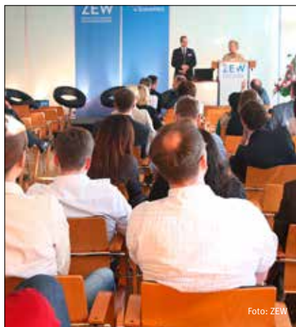
An die Vorträge schlossen sich lebhaftes Diskussions- und Fragerunden zwischen den Referenten und dem Plenum an.

Insbesondere für Schweden und Finnland zeige sich in der Statistik eine geringe Arbeitslosigkeit von Erwachsenen bei gleichzeitig relativ hoher Jugendarbeitslosigkeit. Dies bilde aber nicht zwingend die Realität ab, gab Asplund zu bedenken. Denn dieses Bild basiere auf Daten der europäischen Statistikbehörde Eurostat. Diese wiederum beruhten auf Daten, welche die Gesamtbevölkerung im erwerbsfähigen Alter bereits bei minimalem Kontakt zum Arbeitsmarkt in Beschäftigte oder Arbeitslose einteilten. Gerade in Ländern mit einem hohen Anteil an Schülern und Studenten, die Ferienjobs nachgingen, bestehe somit die Gefahr, dass diese Jugendlichen in eine der beiden Kategorien eingeordnet würden, obwohl diese in der Ausbildungsphase nicht zu den Erwerbspersonen gezählt werden dürften. Insbesondere für die skandinavischen Länder mit einem hohen Anteil an Schülern und Studenten mit Nebenjobs führe dies tendenziell zu einer Überschätzung der Jugendarbeitslosigkeit.