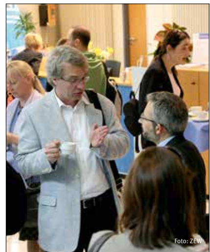
Angeregte Diskussionen fanden während des Pausenkaffees statt.