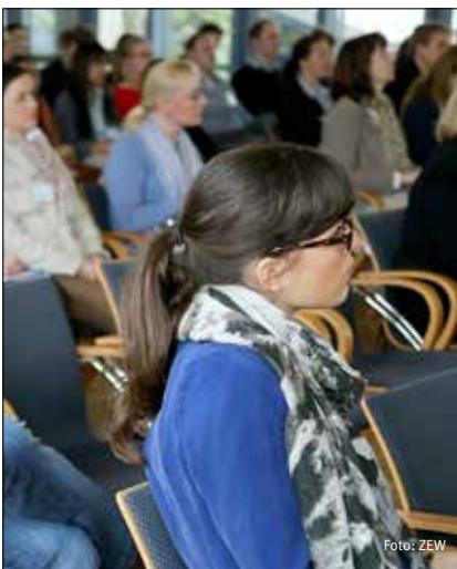
Mit Interesse verfolgten die Konferenzteilnehmer die Vorträge.

Zunehmende Lohnungleichheit, sinkende Anreize für das Individuum, in die eigene Bildung zu investieren, und sinkende Arbeitsproduktivität seien weitere negative Folgen befristeter Beschäftigung. Angesichts dieser Probleme ist die Politik in Spanien nach Ansicht Bentolilas gefordert, das Instrument befristeter Beschäftigung zu überdenken. Spanien sei eventuell besser beraten mit „Flexicurity“ – ein Kompromiss aus gelockertem Kündigungsschutz und ausreichender Arbeitsplatzsicherheit.