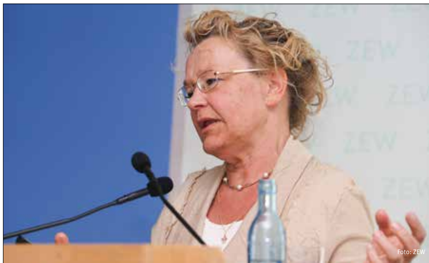
Rita Asplund, Forschungsdirektorin am Forschungsinstitut der finnischen Wirtschaft (ETLA), ging in ihrem Vortrag auf Schwierigkeiten ein, die sich bei der Interpretation von Arbeitsmarktdaten ergeben können.

Ähnliche Schwierigkeiten diskutierte Asplund bei der Beurteilung der empirischen Evidenz zur Polarisierung der europäischen Arbeitsmärkte. Einerseits fänden empirische Studien Evidenz für ein relativ starkes Job-Wachstum am oberen und am unteren Ende der Einkommensskala zu Ungunsten der Jobs im mittleren Lohnbereich. Auf der anderen Seite zeichneten verschiedene Studien ein differenzierteres Bild. Demnach bestehe die eben skizzierte Polarisierung zwar für Großbritannien; Länder wie Schweden, Deutschland oder Frankreich seien davon hingegen nicht betroffen. Ziehe man Daten von Eurofound heran, der Europäischen Stiftung zur Verbesserung der Lebens- und Arbeitsbedingungen, so zeige sich seit Ende der 1990er Jahre bis zum Vorkrisenjahr 2007 im europäischen Durchschnitt ein Jobwachstum vor allem im höheren und in geringerem Umfang auch im mittleren und niedrigen Lohnsegment. Während der jüngsten Finanz- und Wirtschaftskrise zeigten die Daten dann, dass vor allem im mittleren Lohnbereich Arbeitsplätze verloren gegangen seien, was zu einer Polarisierung auf den Arbeitsmärkten beigetragen habe. Für die Zeit nach der Krise zeichneten sich in den europäischen Län-