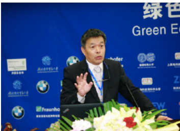
胡鞍钢教授 (清华大学国情研究院院长) : 科技创新与中国经济发展的新动力