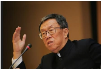
王蒙先生 (著名作家, 曾任中华人民共和国文化部部长、全国政协常委、中国作协副主席等职) : 文学、知识与思想的侨易空间