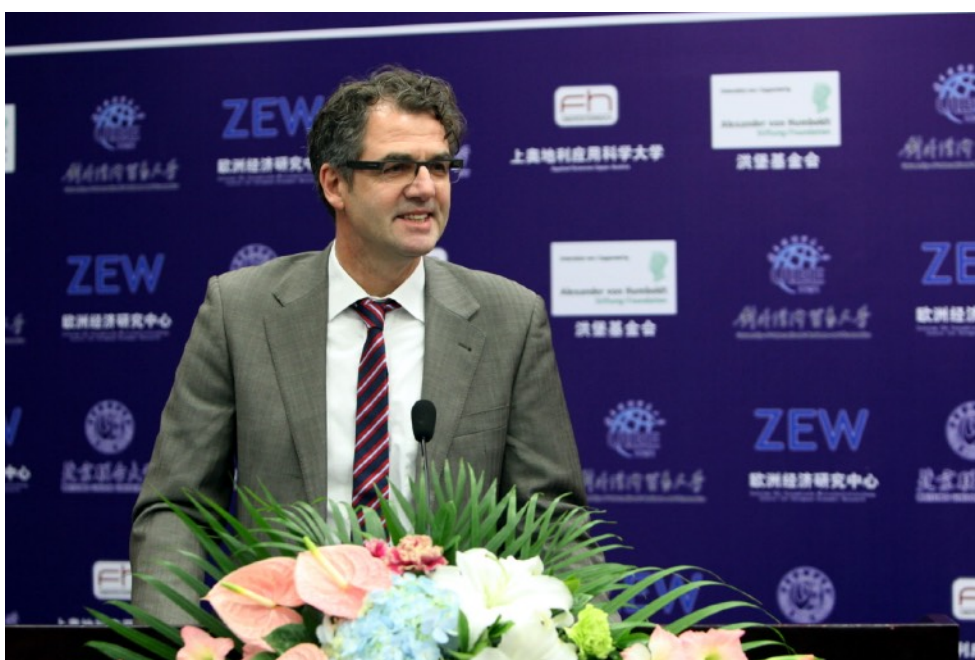
洪堡基金会 亚洲区负责人 曼德拉博士致祝辞