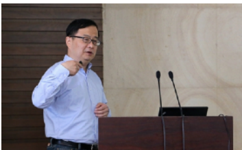
张忠教授 (中科院纳米制造与应用基础研究室主任) : 中国纳米研究现状与未来