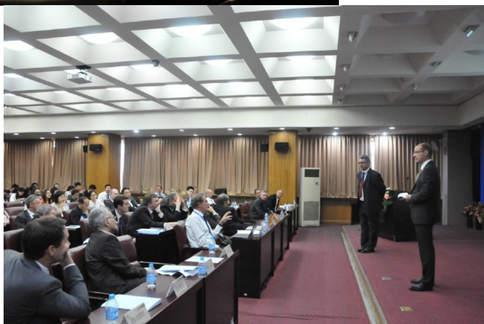
2015年 “绿色物流” 主题论坛