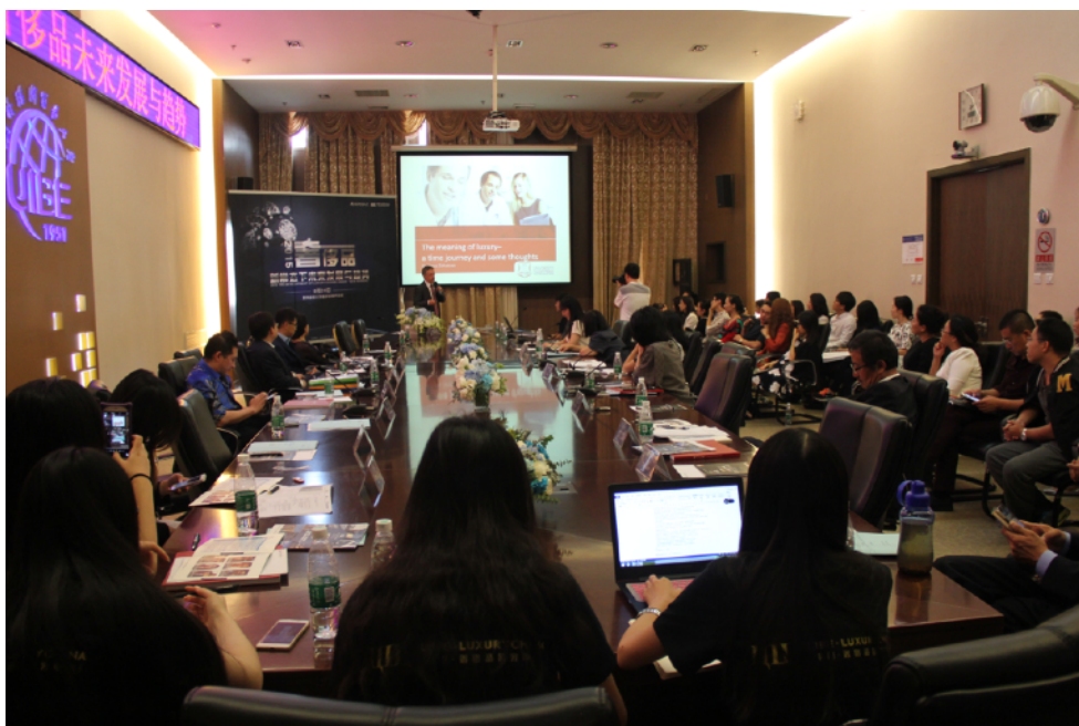
2015年 “新常态下奢侈品发展的未来与趋势” 主题论坛