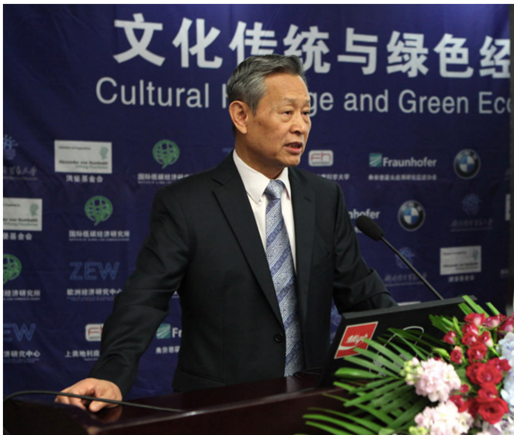
中国工程院前副院长、国家气候变化专家委员会主任、 北京大学核科学与技术研究院院长杜祥琬院士在洪堡论坛上讲话

论坛以亚历山大·冯·洪堡的科学精神及其兄威廉·冯·洪堡的教育精神和人本精神为宗旨，持续致力促进中德、中欧及世界各国之间的科技、经济、文化和政治交流合作。洪堡兄弟作为百科全书型的通才坚持以跨文化、跨专业、开放性态度面对人类科学整体，致力于为科学合作找到跨文化共识，力求跨越东西方文化的障碍，达至一个和谐、共生、可持续发展的新世界。