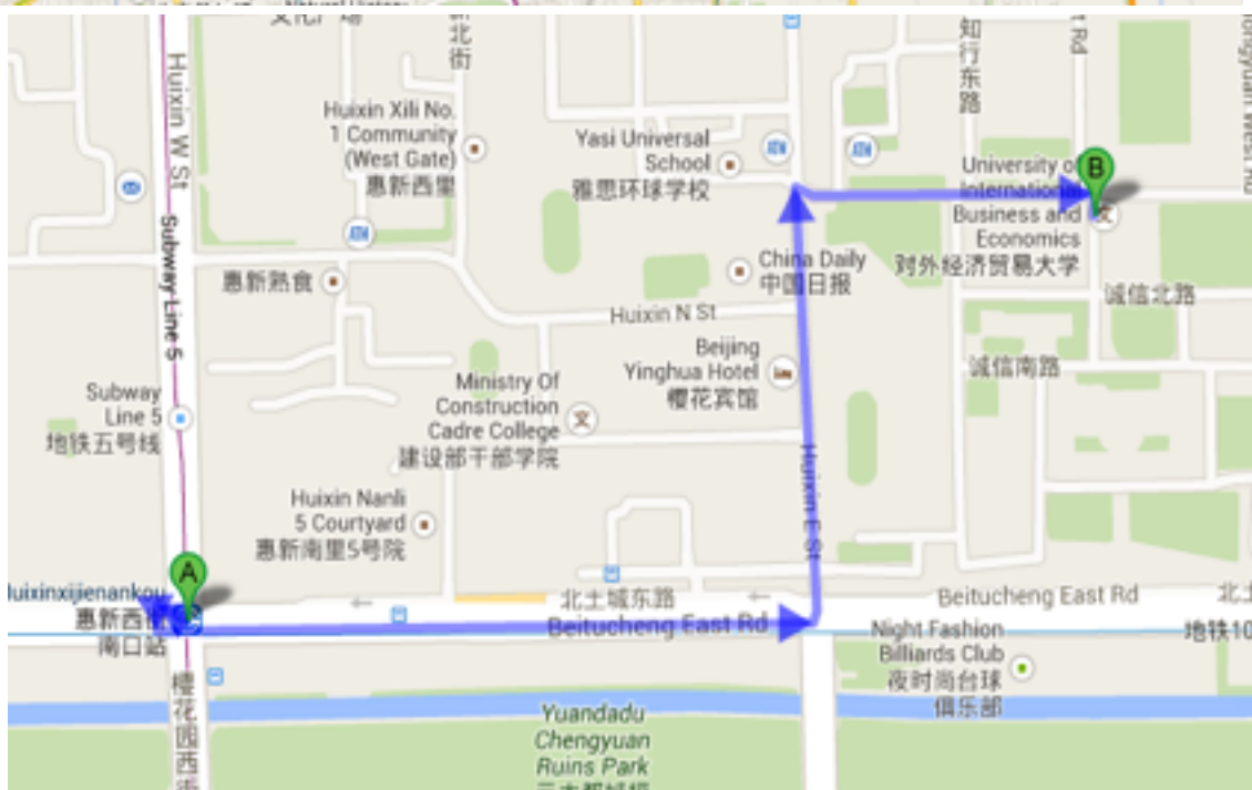
(3) 北京西站----对外经济贸易大学(约17公里): Beijing West Railway Station - University of International Business and Economics (about 17 km)