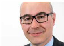
代理主任：王亚心 (Achim Wambach) 博士、教授 环境与资源经济学环境管理