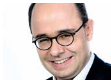
主任：Sascha Steffen 博士、教授 国际金融市场与金融管理