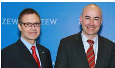
欧洲经济研究院领导： 柯途思 (Thomas Kohl) 与王亚心 (Achim Wambach) 博士、教授

欧洲经济研究院 (Centre for European Economic Research) 简称“欧经院” (ZEW)，位于德国南部曼海姆，是一家独立的非营利科研机构，其法律形式为有限责任公司 (GmbH)。欧经院创立于1991年，现已成为欧洲领先的经济研究机构，并在国际上享有盛誉。