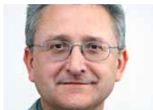
主任：Gunter Grittmann 信息与通讯